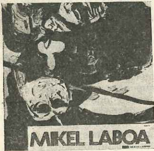
MIKEL LABOA "Bat"-"Hiru" Edigsa/Herri Gogoa HG-85 LS

Mikel Laboa quería sacar un triple lp de entrada. Por lo que se desprende de este doble y de los eps grabados anteriormente, tenía capacidad para hacerlo. Significativamente, un lp se llama Uno, y el otro, Tres; el Dos iba a contener poemas musicados de Brecht, Harzabal, Landart, Espriu... Por unas cosas y otras no salió.